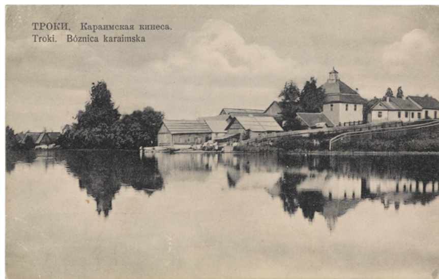
Widok na trocką kienesę od strony jeziora Tatarszki. Pocztówka sprzed 1918 roku.