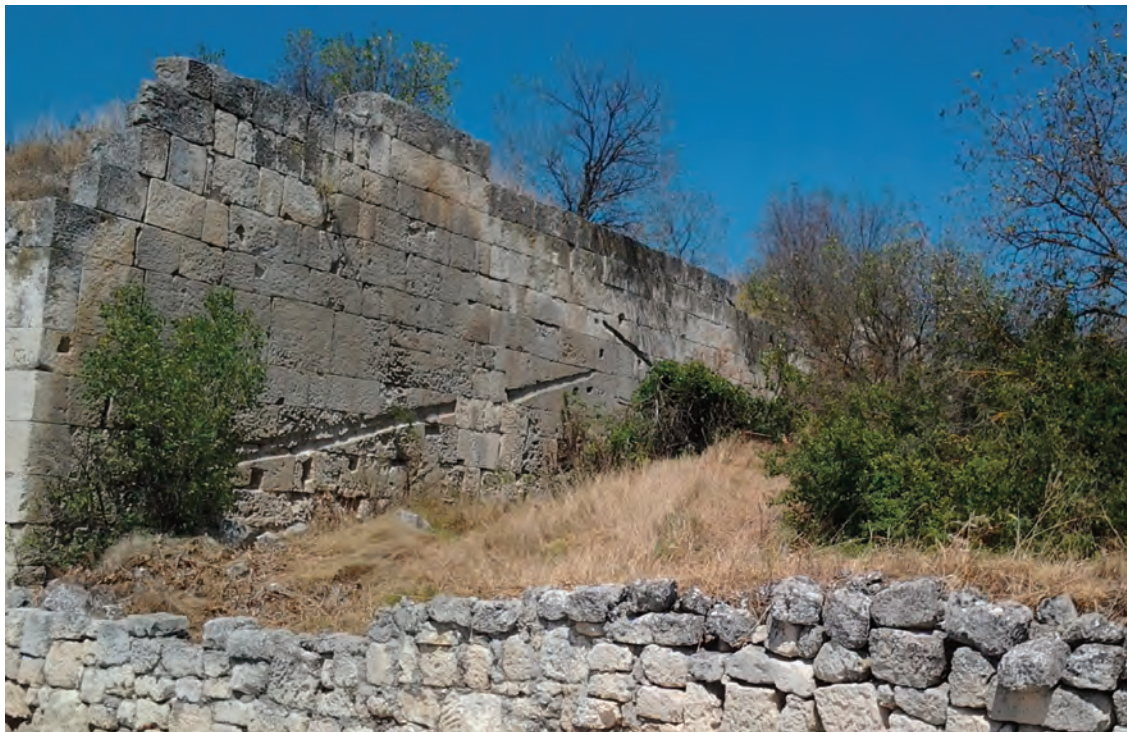
Ślady okopceń na murze wewnętrznym skalnej twierdzy Dżuft Kale w miejscu, gdzie mieściła się chańska mennica.