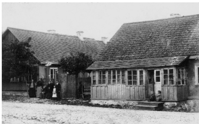
Domy rodziny Kobeckich, ok. 1910 r.

Album został ułożony tak, by dać wrażenie powolnego spaceru po mieście. Fotografie prowadzą uważnego