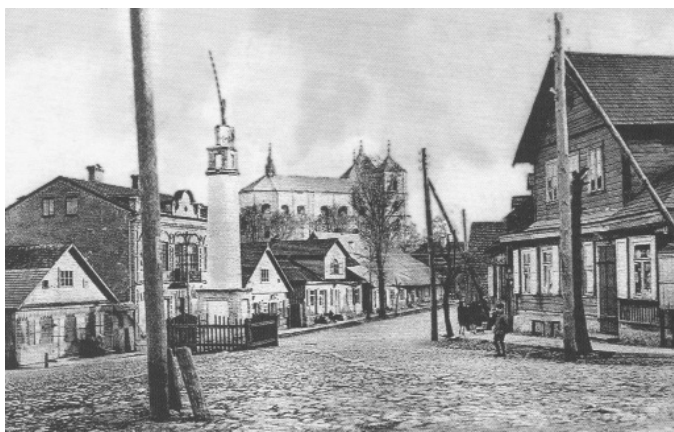
Plac ratuszowy w Trokach, ok. 1910 r.

W dzisiejszych czasach fotografowanie stało się elementem stale nam towarzyszącym i ogólnodostępnym,