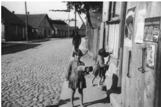
Ulica Karaimska w Trokach, ok 1930 r.

Album zaciekawi tych, którzy zainteresowani są urbanistycznym i historycznym dziedzictwem, architekturą Trok, fotografią artystyczną i historyczną.