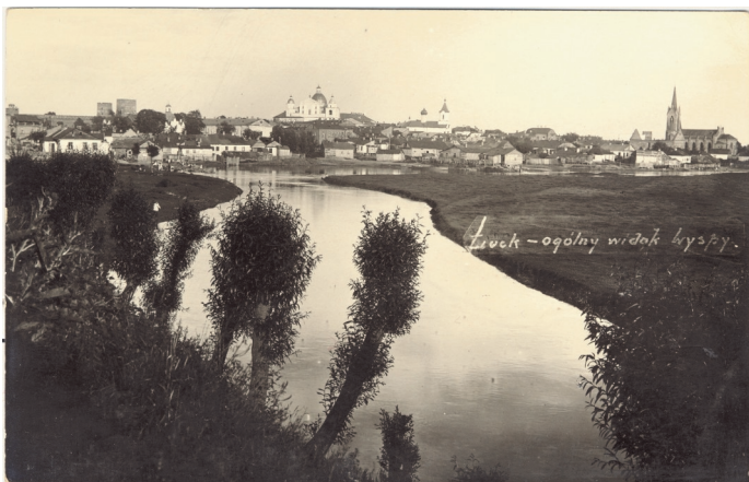
Łuck, 1928 r.

wany proboszczem parafii w Janowej Dolinie również na Wołyniu. Potem doznał gehenny wojennej. Aresztowany i skazany na karę śmierci przez bolszewików, przeszedł przez ciężkie roboty, niemalże cudem umknął... i znalazł się w Stanach Zjednoczonych, gdzie w latach 1948-1953 pracował w stanie Nebraska, po czym przeniósł się do Kanady, by w London (Ontario) organizować polską parafię. I dlatego ta książka, czy tylko jej mała część właśnie tutaj się znalazła.