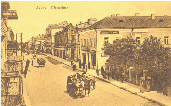
Łuck, 1912 r.

Urodził się w 1905 r. w Kocinie pod Pińczowem, w 1926 r. wstąpił do Seminarium Duchownego w Łucku i tam studiował teologię. Po otrzymaniu święceń kapłańskich, rozpoczął pracę w 1933 r. w Równem na Wołyniu, a w 1936 r. został miano-