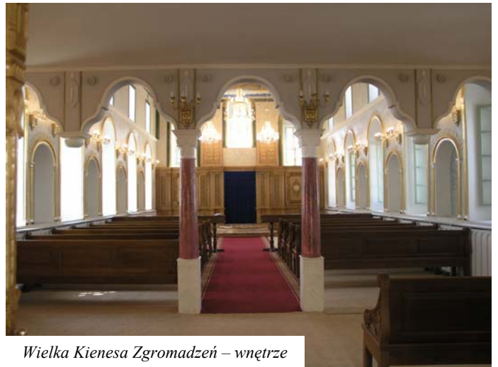
Wielka Kienesy Zgromadzeń – wewnątrz

Podstawą planu Kienesy Zgromadzeń była świątynia Salomona, rekonstrukcja której przedstawiona jest na belce stropowej nad ołtarzem. Kienesy jest również kopią najstarszej na Krymie Wielkiej Kienesy Zgromadzeń w Dżuft-Kale koło Bachczysaraju. Tyle, że ta ostatnia jest zdecydowanie mniejsza i mniej okazała.