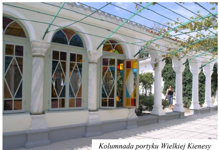
Kolumnada portyku Wielkiej Kienesy

Drugi dziedziniec, w całości wyłożony białym marmurem, nazywany jest dziedzińcem marmurowym lub