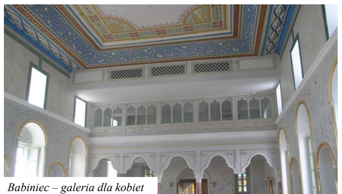
Babiniec – galeria dla kobiet

Nad ołtarzem w złotej aureoli tablice z dziesięciorgiem przykazań. Kolejne tablice z przykazaniami, już bez aureoli, powyżej pierwszych i po obu ich stronach. Przed zasłoną zapalana w czasie nabożeństwa lampa –