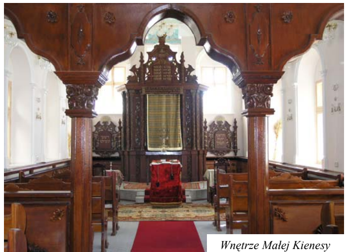
Wnętrze Małej Kienesy

wycofali się, aby następnie przystąpić do ataku. Wtedy to najprawdopodobniej, w czasie ostrzału Eupatorii 5 lutego 1855 r., jedna z kul trafiła w górną część zachodniej ściany kienesy. I tam już pozostała, nie czyniąc dużej szkody. Później wydobyto ją, wprawiono w marmurową tablicę z okolicznościowym napisem i wstawiono ponownie w to samo miejsce. W tymże czasie dla wzmocnienia budynku dobudowano trzy przypory: jed-