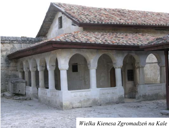
Wielka Kienesy Zgromadzeń na Kale

Z zewnątrz Kienesy Zgromadzeń stanowi niewielki, stosunkowo wysoki, prostokątny budynek w mauretań-