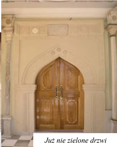
Już nie zielone drzwi

ścian stoją długie, kamienne ławy z góry wyłożone drewnem, a pod spodem mające wnęki na obuwie, które należy zdjąć przed wejściem do świątyni. W zachodniej części