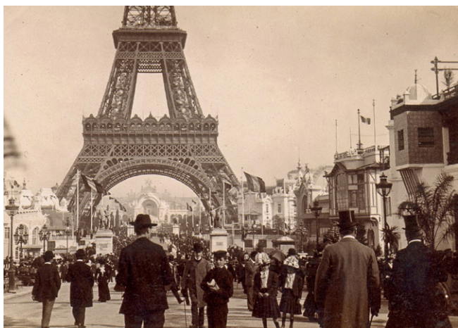
Ulica Narodów.