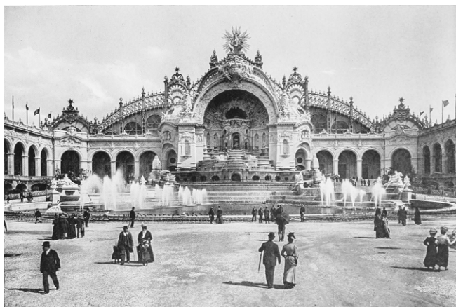
Pałac Wodny.

Najbardziej niesamowity z tych wodnych cudów był sztuczny wodospad buchający z pyska jakiegoś gigantycznego zwierzęcia do niewielkiego stawu poniżej. Nad powierzchnię tego stawu o średnicy około 20–30 metrów i dziwnie ukształtowanych brzegach wystawały pyski przeróżnych morskich potworów, wyrzucające w stronę wodospadu wysokie łukowate strumienie wody, które splatały się ze sobą w różnych kierunkach. Brzegi tej dużej sadzawki obsadzono ozdobną roślinnością i zza jej liści oraz kwiatów wyglądały urocze statuetki uśmiechniętych cherubinków, a z paszcz węży, które ta skrzydlata diatwa trzymała w rękach, strumienie wody spływały w twarze potworów. Wrażenie było jeszcze silniejsze dzięki nieprzerwanemu,