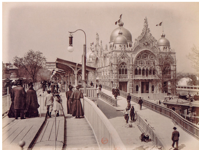
Ruchome chodniki i Pawilon Włoski.

stopami. Dzisiejsze przenośniki taśmowe są metodą transportu podobną do ruchomych chodników. Autobusy stały się obecnie powszechnym środkiem lokomocji, a ruchome chodniki, w wersji zaprezentowanej na wystawie 1900 roku, do tej pory nigdzie się nie przyjęły.