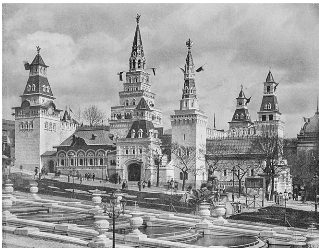
Pawilon Rosyjski.

Fosforyzujący, opalizujący blask tego małego domku nie mógł konkurować wielkością z okazałym tęczowym wodospadem Château d'Eau, ale miał swój urok pieszczący oko... W tamtych czasach efekty świetlne były jeszcze nowością.