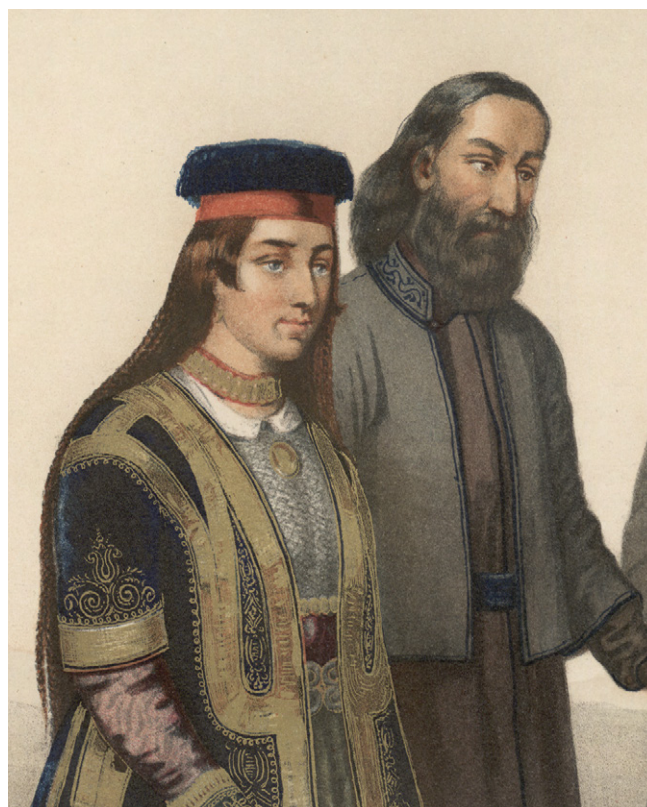
Il. 1. Wizerunek Gabriela Firkowicza i jego żony Mitki. Fragment grafiki z pracy: T. de Pauly, Description ethnographique des peuples de la Russie , Sankt Petersburg 1862.

Przy niedostatku źródeł zwartych biografistyki dotyczącej Karaimów, często wykorzystywaną pozycją jest Караймский биографический словарь ( Karaimski Słownik Biograficzny ) opracowany przez Borysa Eliaszewicza (1881–1971). Ten wydany w 1993 r. owoc blisko pół wieku poszukiwań zawiera ponad czterysta biogramów, w tym niezbyt obszerną notę poświęconą bohaterowi niniejszego artykułu. W jej pierwszej części czytamy: