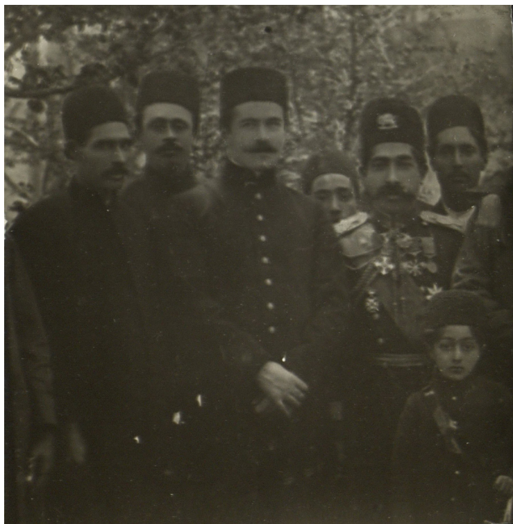
Фото. 3. Мохаммед-Али-Мирза с наследным принцем, С. М. Шапшал. Тавриз, 1903. LMAVB RS Ф. 143. Ед. хр. 1227. Л. 36