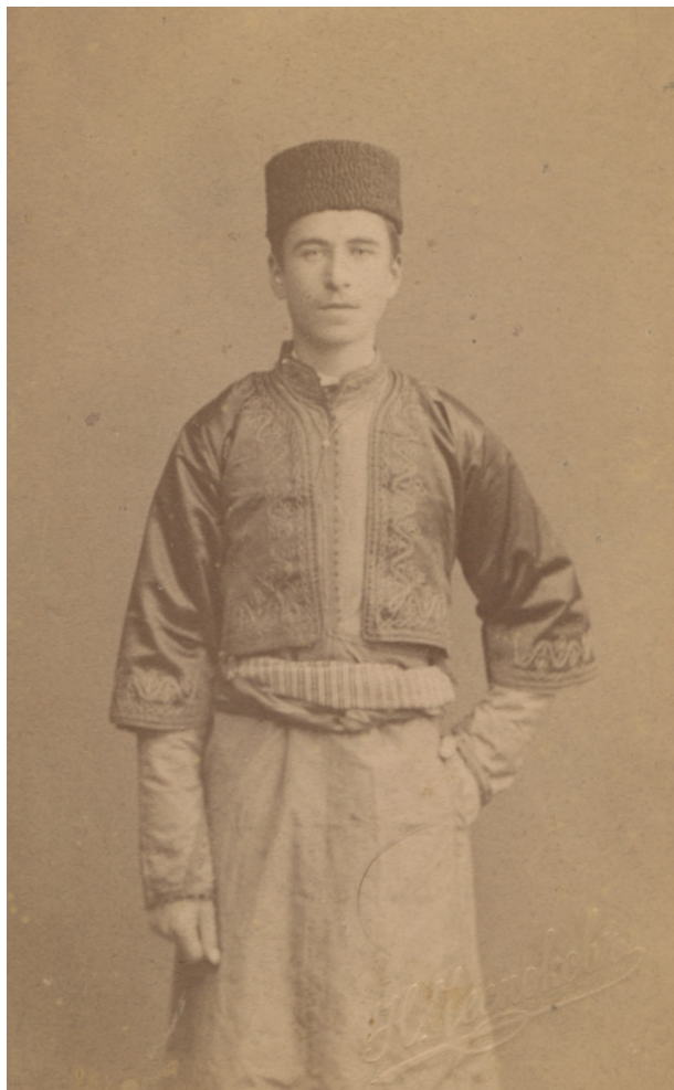
Фото. г. С. М. Шапшал, 1894. Москва, Н. Чесноков. LMAVB RS Ф. 143. Ед .хр. 1207. Л. 7