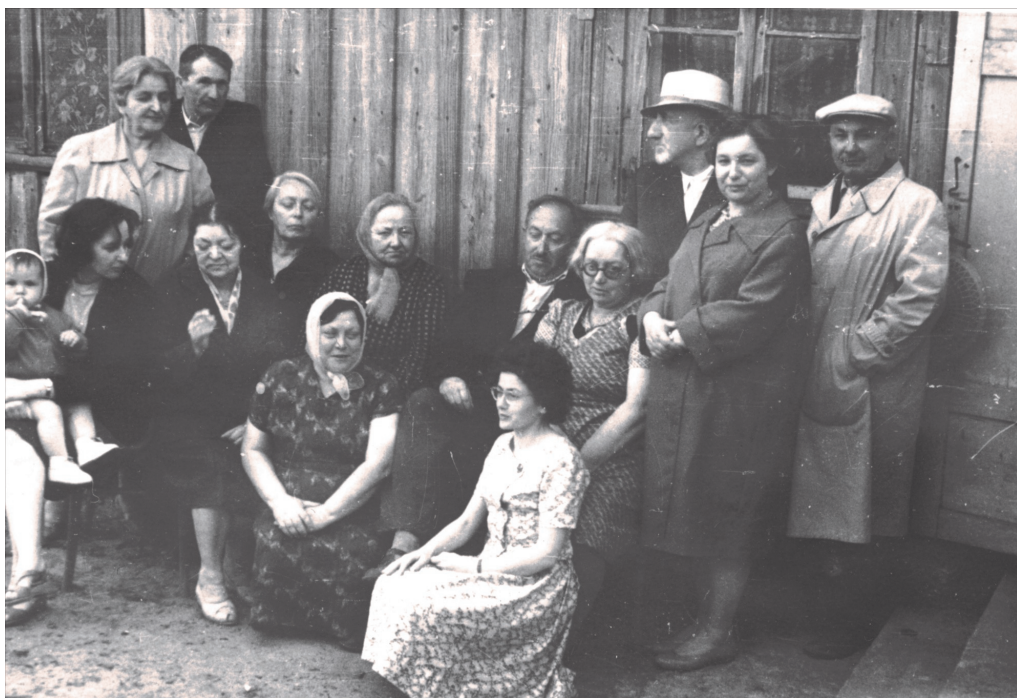
Spotkanie w Trokach, rok 1962

Tak (na razie) kończy się opowieść o Dziadkach – o nich samych i pięciu pokoleniach ich potomków, którzy na przestrzeni stu lat rozproszyli się po świecie. Najbardziej chyba istotna zmiana, jaka wystąpiła podczas tych lat, dotyczy zapewne liczby członków rodziny – wiadomo, że model wielodzietności ustąpił modelowi małodzietności, czy wręcz bezdzietności.